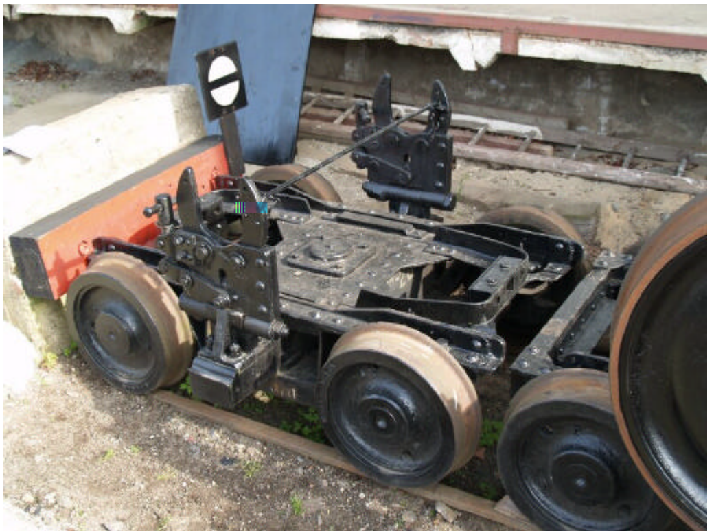
Bild 2: Bei der HSB sind noch einige Exemplare von diesem Typ Rollbock erhalten geblieben. Hier 99-01-20 am Bahnhof Benneckenstein.