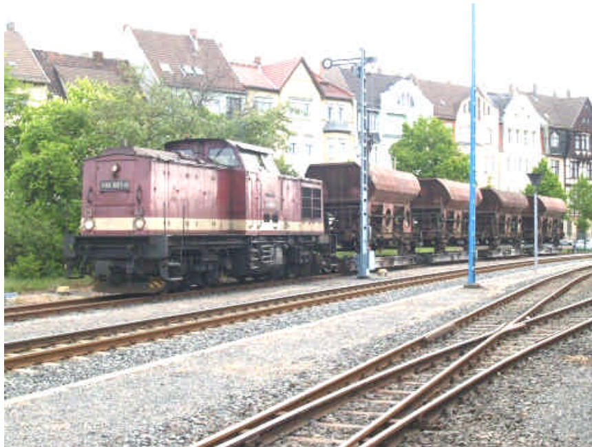
Foto 2: Lok 199 861 voor de HSB eigen bouwtrein. Deze trein wordt vooral bij het baanonderhoud gebruikt om ballast aan te leveren. Het beladen van de wagons gebeurt in de aansluiting van steengroeve Unterberg bij Eisfelder Talmühle. De Wagons zijn ook vaak in fototreinen gebruikt.

Uw trein op maat is waar het ons om gaat!