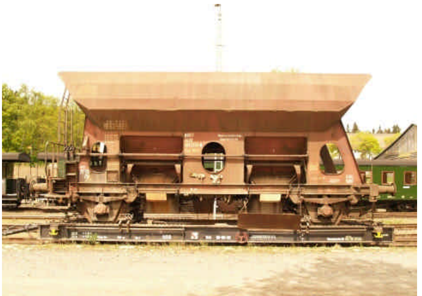
Foto 1: Fcs 00 50 645 2128-8 in Benneckenstein

Door de jaren heen, zijn er in vergelijkbare vorm, duizenden Fcs stortwagens gebouwd. Deze wagons waren in heel europa aan te treffen. Ook in de tegenwoordige tijd zijn nog vele Fcs stortwagens beschikbaar. Op smalspoorbanen was en is dit wagontype vaak aan te treffen. Ook bij de Harzer Schmalspurbahnen waren en zijn de Fcs stortwagens vaak te gast. Zowel op Rollwagens als op de moderne Vevey Rollbocken.